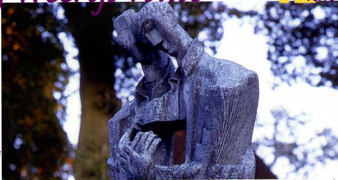
Zadkines beeld van de gebroeders Vincent en Theo van Gogh. Vincent werd in 1853 te Zundert geboren.

De Aa of Weerijs ontspringt in België. In Rijsbergen, Zundert en Effen snijdt de beek diep in het dekzandplateau waardoor het landschap in tweeën wordt gedeeld. Aan de oostzijde liggen de hogere zandgronden. Hier woonden reeds vroeg mensen omdat landbouw mogelijk was. Aan de westzijde bevonden zich moerassen en woeste heidegronden. Tussen 1400 en 1700 werd het hoogveen afgegraven. Deze gronden zijn in de 19e eeuw in cultuur gebracht. Rond 1960 is de Aa of Weerijs genormaliseerd. Het typische beekdalenlandschap verloor daarmee veel van zijn aantrekkelijkheid.