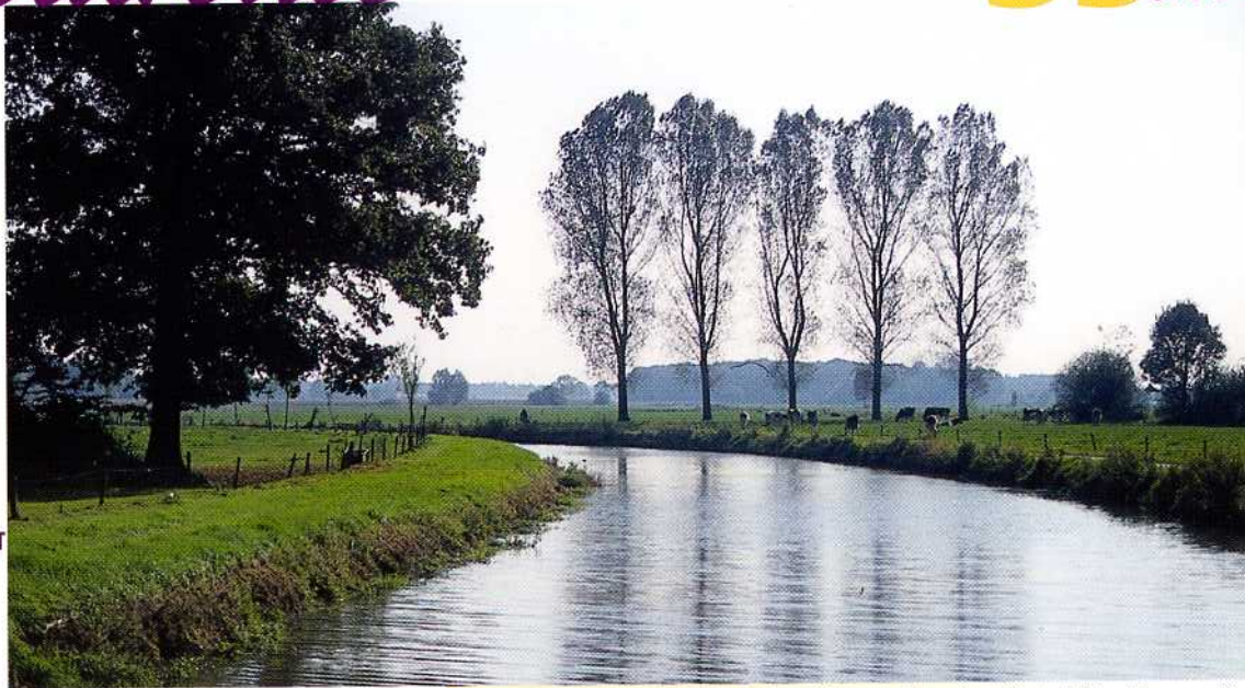
De Mark ten zuiden van Ulvenhout

In de strijd van de Noordelijke Nederlanden tegen Spanje is Breda regelmatig inzet geweest van gevechten tussen beide legers. In 1567 werd de stad veroverd door de Spanjaarden. In 1590 viel de stad weer in handen van de Staatsen dankzij de list met het turfschip. Onder leiding van Ambrosio Spinola belegerden de Spaanse troepen in 1624 de stad. Er werden twee linies rond de stad opgeworpen met op regelmatige afstand schansen en redoutes (kleine schansen). Na een beleg van elf maanden nam Spinola in 1625 de stad in.