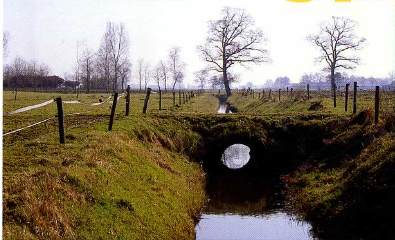
Kleinschalig landschap in het gebied van het Chaamse bekenstelsel

4 Het Bels Lijntje is de naam voor de voormalige spoorlijn tussen Tilburg en Turn-